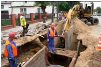
Budowa sieci kanalizacyjnej: Wspólna - Nowy Rynek w Gąbinie

W roku 2007 modernizowano również oczyszczalnię ścieków, której przepustowość zaczyna zbli-