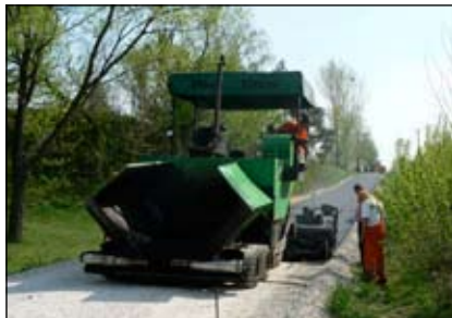
Budowa drogi gminnej w miejscowości Przemysłów

żać się do wartości maksymalnej i w najbliższym okresie musi zostać rozbudowana. Prace nad tą inwesty-