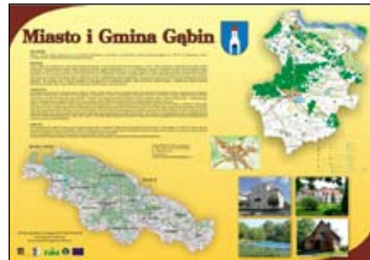
Prospekt tablicy, która stanie w Starym Ryнку

Rozbudowany i jednolity system informacji z pewnością będzie doskonałą reklamą naszego miasta i gminy. Jak twierdzą specjaliści, dla budowania turystycznego i organizacyjnego wizerunku regionu