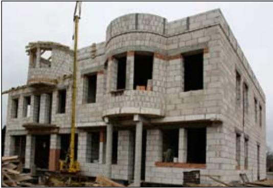
Policjanci na dobre wprowadzą się w styczniu 2009 r.

O fatalnym stanie budynku głośno było już od kilku lat. W roku ubiegłym Komendant Miejski zmuszony był okresowo zamknąć posterunek policji w Gąbinie ze względu na fatalny stan techniczny budynku oraz zastrzeżenia NIK co do warunków pracy i poziomu bezpieczeństwa pracowników. O konieczności budowy nowej siedziby komisariatu Policji wiedzieli wszyscy. Dzięki działaniom podjętym przez Ko-