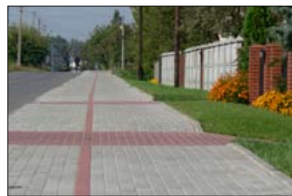
Z każdym rokiem na terenie miasta i gminy przybywa chodników

Ważne miejsce w działalności gminy zajmuje rozwój kultural-