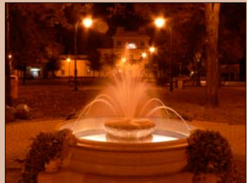
Dzięki fontannie park przy Starym Rynku tętni życiem