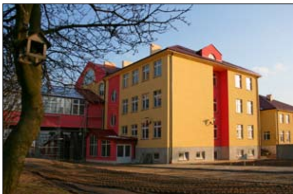
Budowa przedszkola, rozbudowa szkoły podstawowej i gimnazjum w Gąbinie dofinansowana ze środków Unii Europejskiej

Jak ważnymi dla wszystkich mieszkańców są zadania dotyczące infrastruktury, nie trzeba chyba wspominać. Przewidziane do realizacji w bieżącym roku prace w zakresie