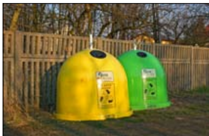
Gąbińskie ulice i parki wyglądają tak...