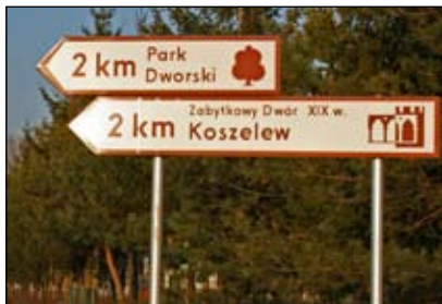
Tablice kierunkowe utwierdzają orientację w terenie

Na terenie Miasta i Gminy Gąbin pojawiły się niedawno tablice kierunkowe oraz tablice informacji turystycznej mające na celu ułatwienie turystom oraz mieszkańcom orientacji wśród znajdujących się na terenie zabytków, pomników przyrody, Miejsc Pamięci Narodowej itp. Realizacja przedsięwzięcia była możliwa dzięki dotacji z programu „Leader +”, którą otrzymało Stowarzyszenie Gmin Turystycznych Pojezierza Gostynińskiego. Warto w tym miejscu przypomnieć, że Stowarzyszenie, do którego należy także Miasto i Gmina Gąbin, działa nieprzerwanie od 1996r. promując bogactwo przyrodnicze, kulturowe, historyczne i turystyczne regionu. 1 Zasięgiem działania obejmuje ono zachodnią część województwa mazowieckiego oraz trzy gminy województwa kujawsko-pomorskiego. „Leader +” jest natomiast programem bezwrotnej pomocy ze strony Unii Europejskiej dla określonych jednostek. Władze lokalne, organizacje pozarządowe, przedsiębiorcy otrzymują pomoc w związku ze zgłaszanymi projektami rozwoju regionalnego w krajach członkowskich. Stowarzyszenie Gmin Turystycznych Pojezierza Gostynińskiego opracowało projekt polegający na stworzeniu wspólnego dla całego obszaru jednolitego systemu informacji. Umieszczone w ważnych dla zwiedzających punktach miasta i okolic tablice pomagają zorientować się w terenie oraz wybrać kolejny cel podróży. Zawierają ogólne plany terenu oraz szczegółowe plany miejsca