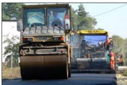
Modernizacja drogi gminnej w miejscowości Jordanów

Należy również wspomnieć o zadaniu pn. „Termomodernizacja węzłów cieplnych i ciepłociągów dosyłowych do budynków mieszkalnych wielorodzinnych z kotłowni osiedlowej w ul. Wojska Polskiego” – inwestycja pozwoli ograniczyć straty ciepła oraz w pełni zautomatyzować