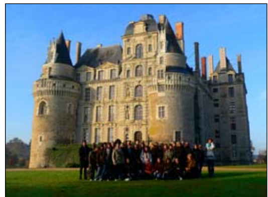
Wycieczka gimnazjalistów pod zamkiem Brissac

na zawody strażackie. Uczniowie z terenu gąbińskiej gminy należący do młodzieżowych drużyn OSP wzięli w nich udział pod koniec czerwca. Dzięki uzyskanemu z Ministerstwa Edukacji Narodowej dofinansowaniu młodzież z Gąbina i okolicznych szkół w listopadzie po raz kolejny odwiedziła Saint-Barthelemy d’Anjou. Uczniowie zawieźli przyjaciółom z Francji skrawek Polski (koncert w regionalnych strojach), ze wzruszeniem przyjęty przez ludność polskiego pochodzenia. Liczymy, że w 2008 roku współpraca będzie równie owocna.