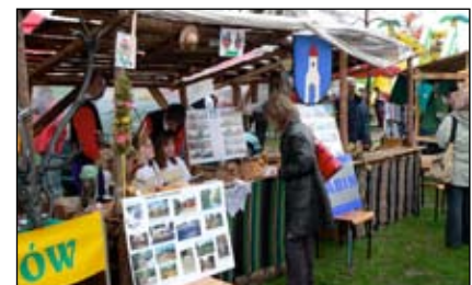
Od kilku lat nasze stoisko przygotowuje szkoła Podstawowa w Czermnie i MGOK w Gąbinie

Szczegóły już niedługo na naszej stronie www.gabin.pl .